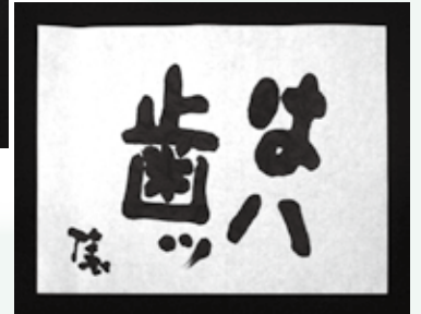
▲俵氏の書(医院にも飾っています)